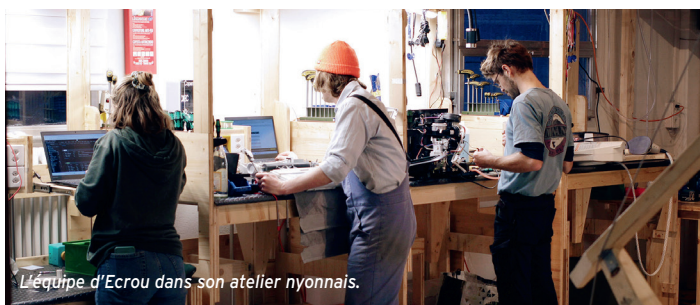
L'équipe d'Ecrou dans son atelier nyonnais.