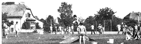
Jeux d'« Omnisports », 1980

Renseignements et contact : www.omnisports.ch